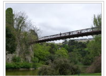
Les Buttes Chaumont