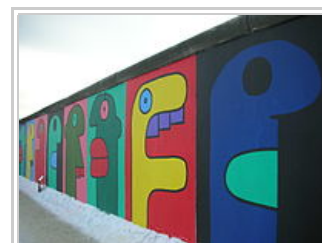
East side gallery, Berlin

Le midi, nous pique-niquerons ; le soir, nous mangerons dans des lieux divers, au gré de nos balades. Seuls deux dîners sont réservés : celui de l'arrivée samedi 26 avril et celui du départ vendredi 2 mai.