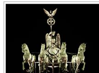
Le quadriga, porte de Brandebourg

Le choix de nos balades thématiques est subjectif, mais essaie de vous montrer des facettes singulières de cette ville sur les plans urbanistique, artistique, architectural et vie de société. Klaus – avec quelques interventions de locaux – vous donnera des commentaires et traductions pendant les marches.