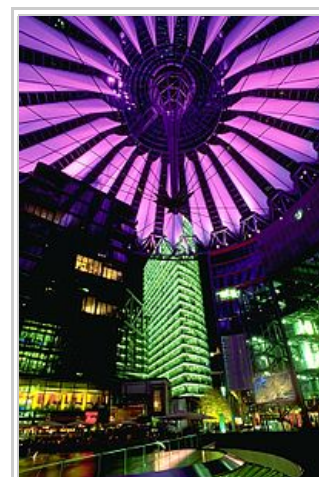
Sony Center, la nuit

tél. 0359893354, 0684152377, bassée.en.balade@gmail.com ( mailto:bassée.en.balade@gmail.com ) , site.benb.fr ( http://site.benb.fr ) Agréée par le Ministère de la Jeunesse et des Sports sous le n° 59 S 3008 Bénéficiaire de l'immatriculation tourisme n° IM075100382 de la Fédération Française de la Randonnée Pédestre, 64 rue du Dessous des Berges, 75013 Paris N° SIRET 447 712 670 00010, code NAF 93.12Z