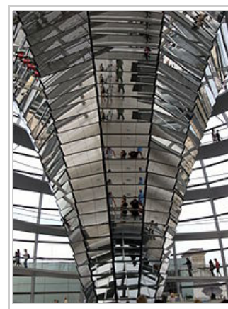
Miroir dans la coupole du Reichstag