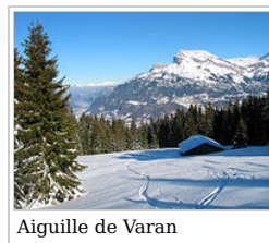
Aiguille de Varan