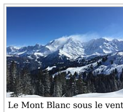
Le Mont Blanc sous le vent

Le Chalet l'Aiglon ( http://www.chalet-aiglon.com/ ) 1356 Avenue de Miage, 74170 Saint-Gervais-les-Bains, tél. 04 50 78 31 22, met à notre disposition un magnifique gîte de grand confort, situé sur la route des Contamines-Monjoie ( http://maps.google.com/maps?q=Chalet+l'+Aiglon@45.879355,6.716392&z=16 ) dans le Val Montjoie.