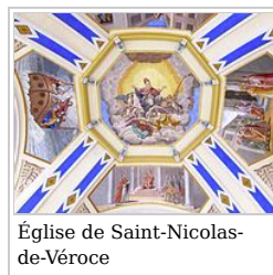
Église de Saint-Nicolas-de-Véroce

Les inscriptions sont notées au fur et à mesure de la réception du bulletin d'inscription accompagné de deux chèques