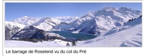
Le barrage de Roselend vu du col du Pré

Beaufort-sur-Doron qui se situe sur un plateau à 1100 m d'altitude, après une rude montée qui nécessite des équipements spéciaux et des chaînes en cas de neige.