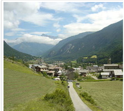
Le village de B

La dernière modification de cette page a été faite le 22 juillet 2018 à 06:46.