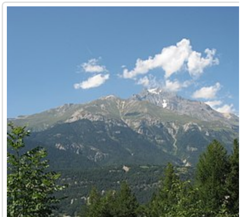
La Dent Parrachée (3