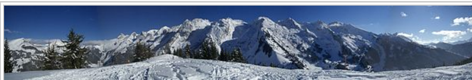
La chaîne des Aravis, versant ouest