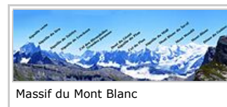
Massif du Mont Blanc

tél. +33(0)359893354, +33(0)684152377, bassée.en.balade@gmail.com ( mailto:bassée.en.balade@gmail.com ) , benb.eu.org ( http://benb.eu.org ) Agréée par le Ministère de la Jeunesse et des Sports sous le n° 59 S 3008 Bénéficiaire de l'immatriculation tourisme n° IM075100382 de la Fédération Française de la Randonnée Pédestre, 64 rue du Dessous des Berges, 75013 Paris N° SIRET 447 712 670 00010, code NAF 93.12Z