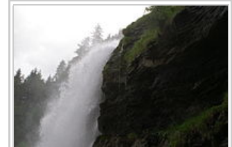
La cascade du Rouget

Samoëns est un magnifique village qui a su conserver, en partie, le charme de ses anciennes maisons dans son centre. La vallée du Giffre, le torrent qui descend du Cirque du Fer-à-Cheval et se jette dans l'Arve, sera le terrain de jeu de cette semaine de randonnées.