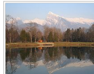
Le Criou en hiver

Samoëns est un magnifique village qui a su conserver, en partie, le charme de ses anciennes maisons dans son centre. Morillon est un joli village qui mise sur le tourisme. La vallée du Giffre, le torrent qui descend du Cirque du Fer-à-Cheval et se jette dans l'Arve, sera le terrain de jeu de cette semaine de randonnées en raquette à neige.