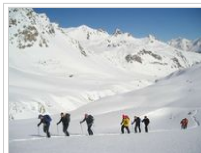
Montée au refuge du Mont Thabor (2502 m)

Bramans, aux portes du Parc national de la Vanoise ( http://www.vanoise.com/ ), le long de la route qui mène au col de l'Iseran et au col du Mont Cenis et à l'Italie, sera le départ de la plupart de nos balades en raquettes avec Aussois. Vous trouverez sur place presque toutes les commodités que vous souhaitez dans ce village de 400 âmes qui a su rester lui-même et qui vient de fusionner avec les communes de Lanslebourg-Mont-Cenis, Lanslevillard, Sollières-Sardières et Termignon pour former la commune nouvelle de Val-Cenis.