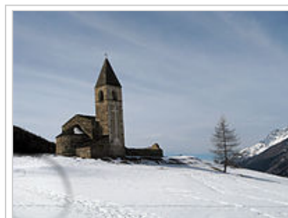
Église Saint-Pierre d'Extravache