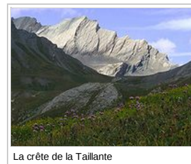
La crête de la Taillante

V% C3%A9ran &hl=fr&ie=UTF8&sl=46.75984,1.738281&sspn=12.226619,18.676758&geocode=FeUqAwMdReEqACIL9D8zZi_dRzHQdWSBPvEKBA%3BFaQUqgldW85oAV% C3%A9r &h&mra=ls&z=7) au départ de La Bassée, arrivée au gîte Les Perce-Neige ( http://chezvincentmathieu.free.fr ) , tél. 04 92 45 82 23 ; accueil à partir de 17 heures ;