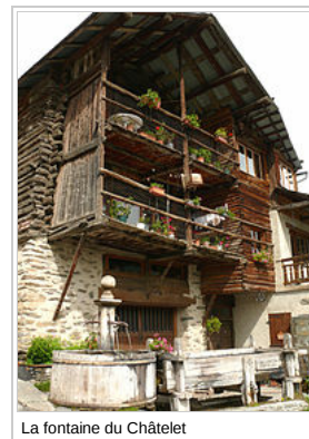
La fontaine du Châtelet

le trajet ( https://maps.google.fr/maps?saddr=La+Bassée&daddr=Saint-