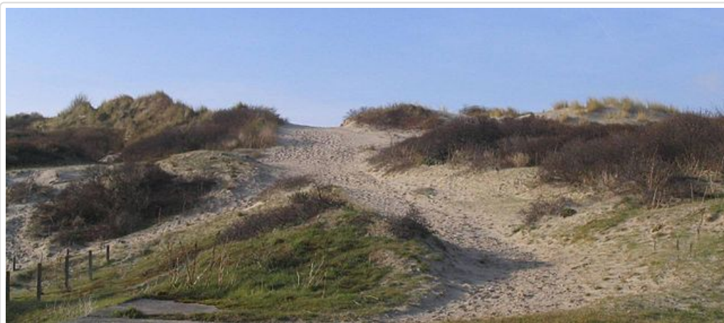
Les dunes de Fort-Mahon-Plage.

Fort-Mahon-Plage ( http://fr.wikipedia.org/wiki/Fort-Mahon-Plage ) est une station balnéaire de la Côte d'Opale ( http://fr.wikipedia.org/wiki/C%C3%B4te_d%27Opale ), entre les baies d'Authie ( http://fr.wikipedia.org/wiki/Baie_d%27Authie ) et de Somme ( http://fr.wikipedia.org/wiki/Baie_de_Somme ). L'immense plage de sable fin, le massif dunaire, la baie d'Authie seront notre terrain de marche.