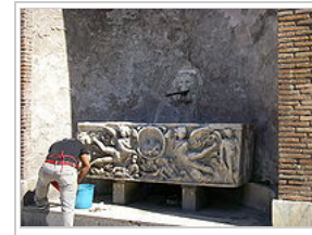
Un ouvrier du bâtiment lave ses outils, face au Colisée, dans une fontaine dont le bassin est un sarcophage antique.

Bassée en Balade propose un séjour particulier puisqu'il s'agit d'un séjour dans une ville, capitale européenne. Il y aura donc non seulement la dimension de la marche à pied, mais aussi une dimension culturelle : les lieux et les édifices que nous verrons ou visiterons, feront l'objet de commentaires, de manière à donner des repères topographiques, historiques et artistiques. Nous visiterons des sites prestigieux dans Rome : le Colisée, le Palatin, les forums..., la basilique Saint-Pierre au Vatican, mais aussi le quartier moderne d'EUR et le Trastevere ; nous irons jusqu'à Ostia Antica, le port de la Rome antique, et à Tivoli, au nord de Rome. Tout cela dans des déambulations qui nous permettront de voir combien l'antiquité et le XVII e siècle façonnent la vie et la ville de la Rome actuelle.