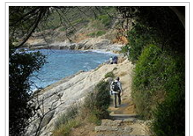
Le sentier du Littoral