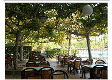
La terrasse du Capet

Grande terrasse ombragée, soirée animées avec un chef qui nous promet une cuisine ensoleillée, vin compris.