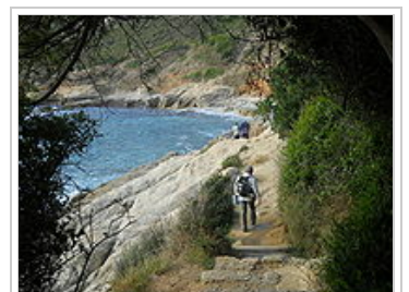
Le sentier du Littoral