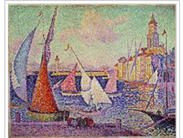
Port de Saint-Tropez, Paul Signac

Nous cheminerons sur les sentiers préservés du littoral, entre Ramatuelle et Saint-Aygulf, explorerons les hauteurs des petites Maures jusqu'au rocher de Roquebrune, terre de feu