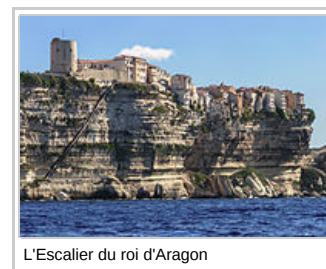
L'Escalier du roi d'Aragon

Les inscriptions sont notées au fur et à mesure de la réception du bulletin d'inscription accompagné de 2 chèques à l'ordre de Bassée en Balade (voir les bulletins d'inscription) et au plus tard le samedi 24 janvier 2015 . Les chèques-vacances sont acceptés. Le second chèque sera mis en banque le 5 mai 2015.