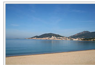
Ajaccio, depuis la plage de Ricanto