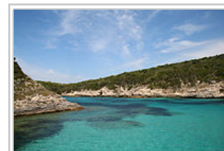
Bonifacio, les calanques de Fazio et Paraguano