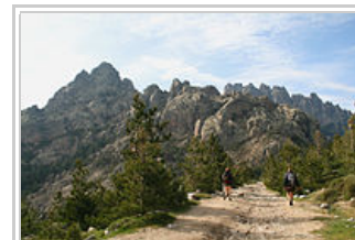
Les aiguilles de Bavella

La Corse fait rêver, le GR 20 fascine. Mais plutôt que de marcher dans un désert minéral au milieu de la montagne Corse, nous visiterons deux villes et leur environnement – Ajaccio et Bonifacio – et traverserons la Corse du sud pendant dix jours de randonnée itinérante – le Mare à monti sud et le Mare a mare sud –, s'arrêtant chaque jour dans une petite ville, un village ou un hameau.