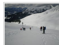
Descente sur la Golèse