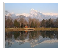
Le Criou en hiver

Il convient d'être suffisamment entraîné pour apprécier pleinement ce séjour. Un bon équipement — veste, pantalon, chaussures étanches, gants, bonnet, lunettes de soleil — permet d'affronter le froid de la montagne en hiver. Quant au sac à dos, on le prendra à bonne taille pour permettre le transport du pique-nique, de la boisson — bouteille thermos indispensable — et des vêtements chauds.