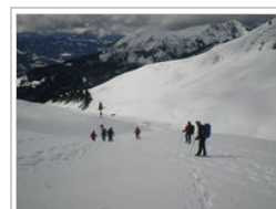
Descente sur la Golèse