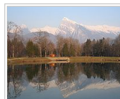
Le Criou en hiver

Samoëns est un magnifique village qui a su conserver, en partie, le charme de ses anciennes maisons dans son centre. Morillon est un joli village qui mise sur le tourisme. La vallée du Giffre, le torrent qui descend du Cirque du Fer-à-Cheval et se jette dans l'Arve, sera le terrain de jeu de cette semaine de randonnées en raquette à neige.