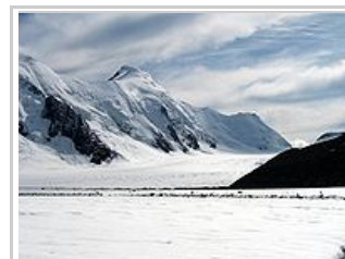
Le Aletschhorn vu de Konkordiaplatz

S'il ne possède pas autant de 4000 que son voisin le Valais, le massif de l'Oberland est un massif glaciaire prestigieux qui donne naissance au plus grand glacier des Alpes, le glacier d'Aletsch (25 kilomètres de long, près de 800 mètres d'épaisseur à Konkordiaplatz). Certains de ses sommets comme l'Eiger ou la Jungfrau font partie de la légende alpine. Paradoxalement, ces immenses glaciers permettent une randonnée d'altitude facile, accessible à tout bon marcheur – étapes de 4 à 6 heures, dénivellation positive maximum de 900 mètres –, dans un cadre haute montagne exceptionnel : la façon idéale de passer de la randonnée sur sentier aux glaciers avec, cerise sur le Strudel, l'ascension d'un sommet facile à près de 4000 mètres, l'Äbeni Flue (3962 m).