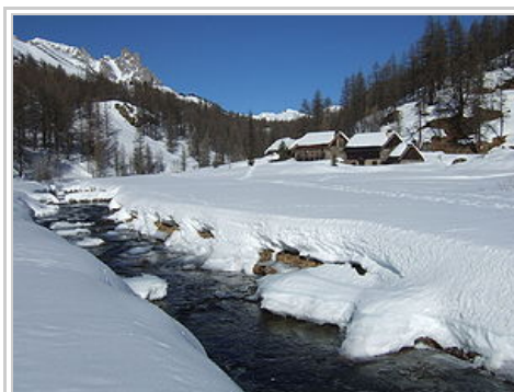
La Clarée au Jadis