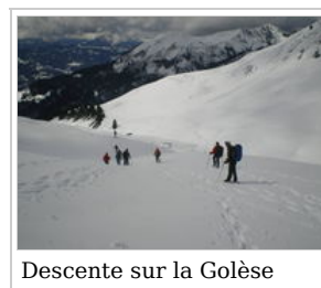
Descente sur la Golèse