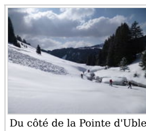
Du côté de la Pointe d'Uble