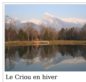
Le Criou en hiver

Samoëns est un magnifique village qui a su conserver, en partie, le charme de ses anciennes maisons dans son centre. Morillon est un joli village qui mise sur le tourisme. La vallée du Giffre, le torrent qui descend du Cirque du Fer-à-Cheval et se jette dans l'Arve, sera le terrain de jeu de cette semaine de randonnées en raquette à neige.