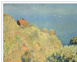
Claude Monet, La maison du pêcheur , Varengeville, 1882