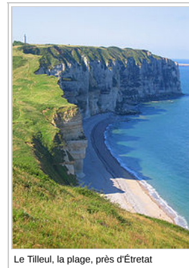
Le Tilleul, la plage, près d'Étretat