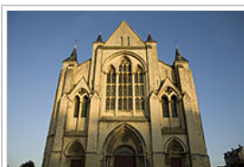
Eu, la collégiale Notre-Dame et Saint-Laurent