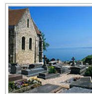
Cimetière marin de Varengeville