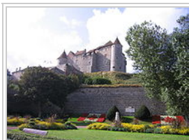
Dieppe, le château